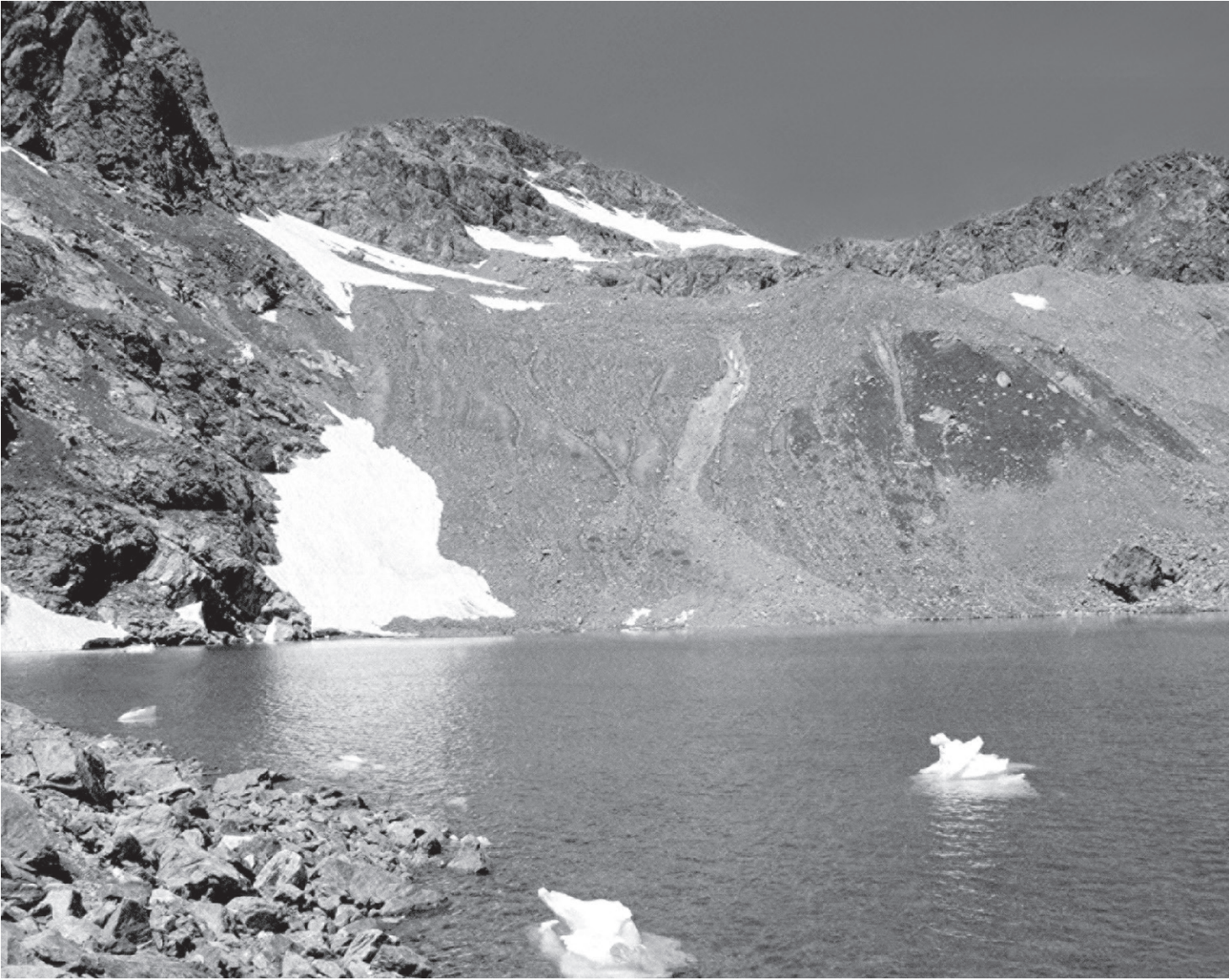
Перевал Заячьи Ушки

Каждый год собирались вокруг пещеры Богини все звери и птицы лесов, гор и полей, приносили ей свои просьбы и жалобы, показывали родившихся детёнышей. Апсаты не только защищала своих подданных, но, если это было необходимо, лечила их болезни, подбирая для этого лекарственные травы и показывая дорогу к целебным источникам. А когда случался лесной пожар,