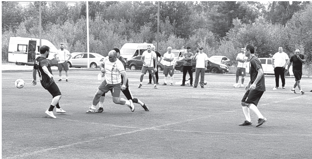
Таких зрелищных моментов на чемпионате было много

спортсмены Карачаево-Черкесии по итогам официальных соревнований в июле завоевали 11 медалей различного достоинства.