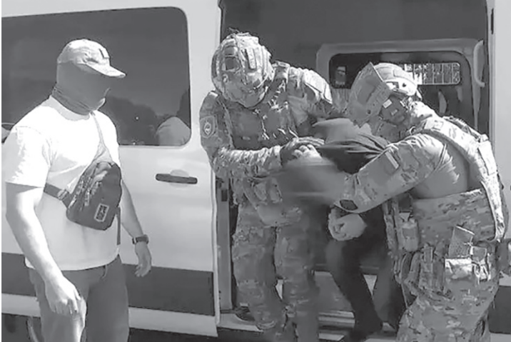
Российские правоохранители успешно борются с терроризмом

Примеров вовлечения людей, а в особенности подростков в диверсионно-террористическую деятельность огромное множество, что, конечно, говорит о том, что враг не дремлет и использует самые разные способы борьбы, стремясь навредить нам руками наших же детей. Но остается открытым вопрос, а все ли мы делаем, чтобы воспитать в наших детях любовь к ближнему и уважение к Родине?