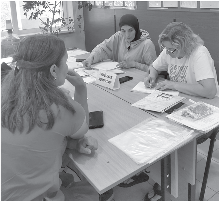
Чтобы выпускники выбирали рабочие профессии, нужны новые возможности для развития

когда ведется специальная военная операция, стало необходимо возрождать наши заводы, в том числе заводы станкостроения. А надо сказать, что наше машиностроение производило такое оборудование в 50-х, 60-х, 70-х годах, которое до сих пор работает! Это у нас перестали их