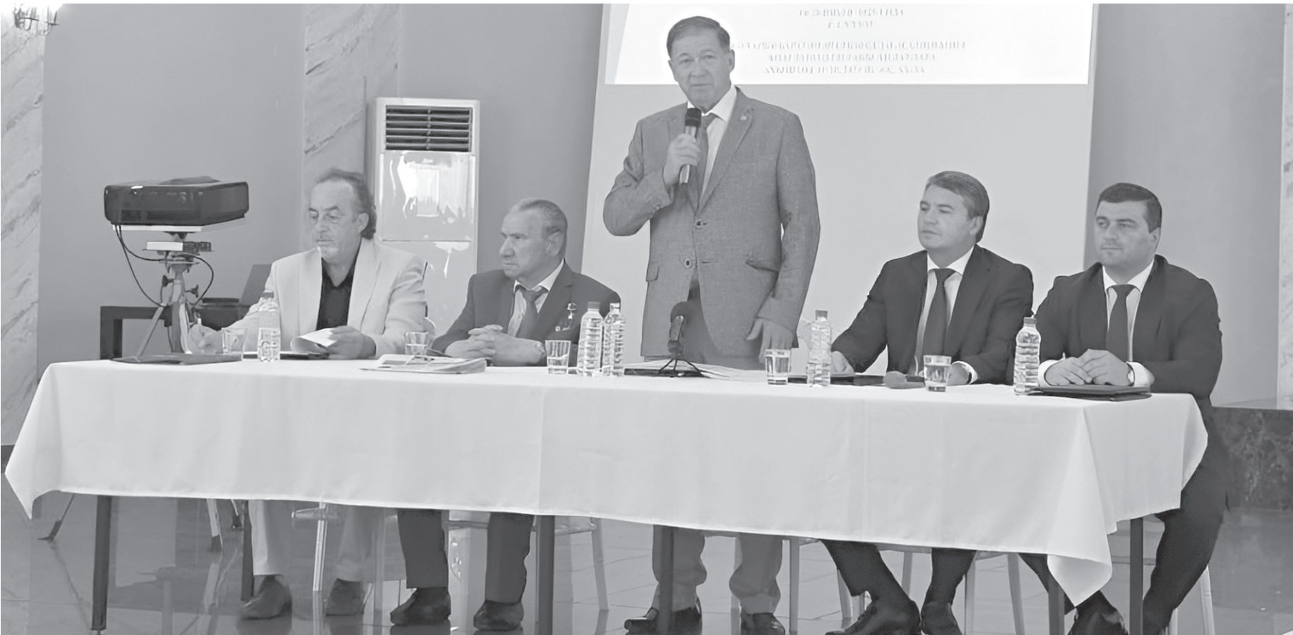
Идет заседание Международной Черкесской Ассоциации

«Мы не просто этнос. Мы — культура. А культура держится на нравственности. Наши обычаи, наш адыгэ хабэз — это не музей. Это код, по которому строится поведение. Если мы это потеряем, ни язык, ни флаги не